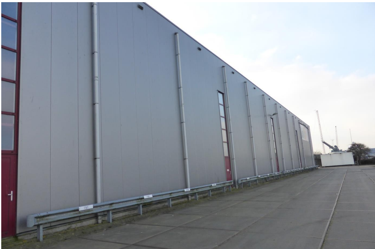
Achterzijde Sluisjesdijk 119 – 121 Rotterdam