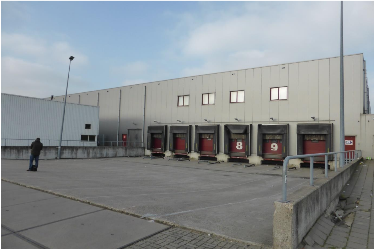
Voorzijde Sluisjesdijk 119 – 121 Rotterdam